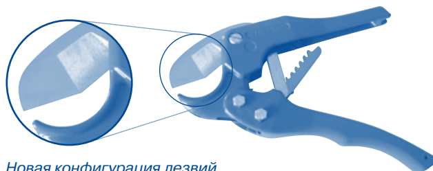
Новая конфигурация лезвий

Рекомендуем использовать новые ножницы Profi. Благодаря новой конфигурации работать с ножницами стало проще. Этими ножницами можно резать все типы труб Ekoplastik.